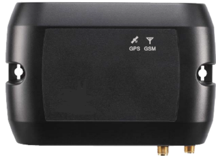
LED 燈號狀態表示列表